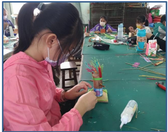
說明：用樹枝及其他素材創作人偶