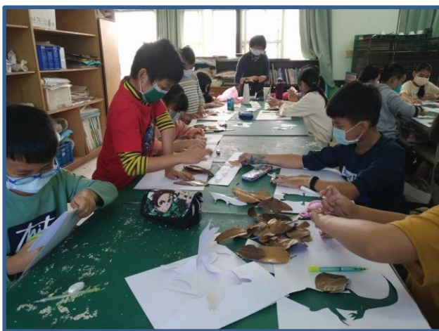
說明：學生用樹葉拼貼