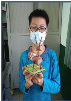
說明：「立體創作」作品 1