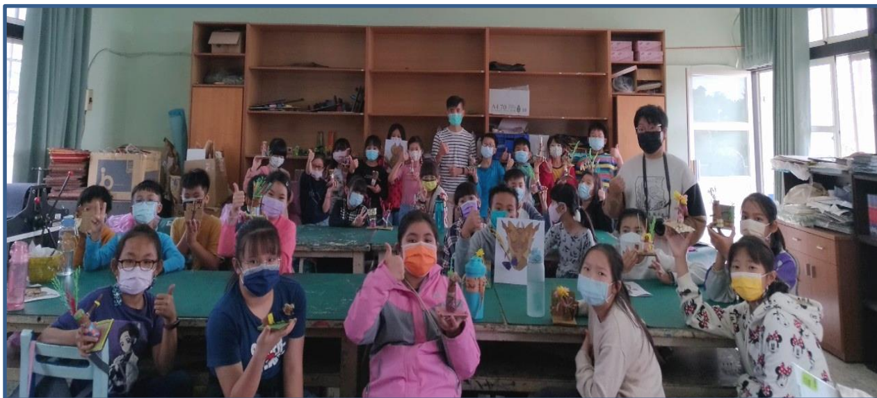
說明：講師、助教及學生於活動結束後大合影