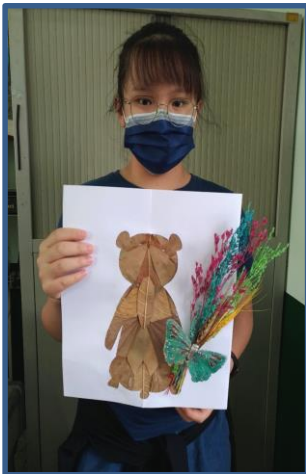
說明：「巧手拼貼」作品 1