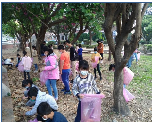
說明：學生到校園撿拾樹葉、樹枝、果實