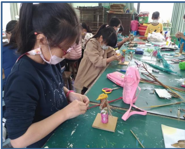
說明：用樹枝及其他素材創作人偶