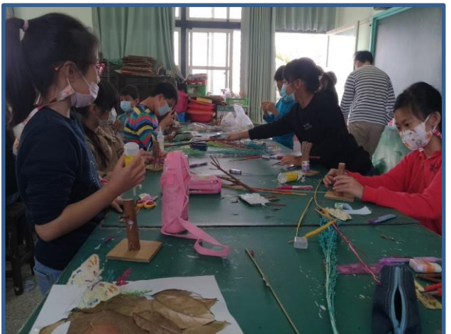
說明：學生用樹葉拼貼並結合其他素材