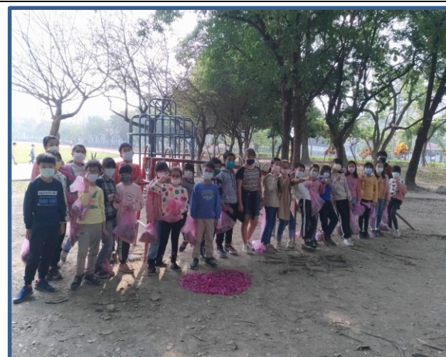
說明：用樹枝、樹葉、果實排出「我 ♥ 潮小」