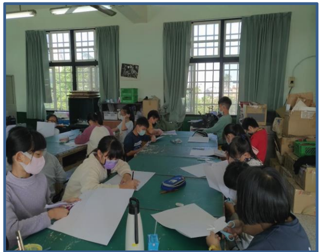
說明：學生動手做「巧手拼貼」