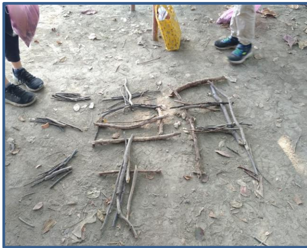
說明：地景藝術創作-用樹枝排出「潮」