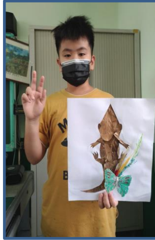
說明：「巧手拼貼」作品 2