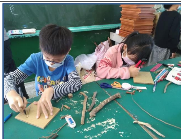
說明：構思「奇幻臉譜」