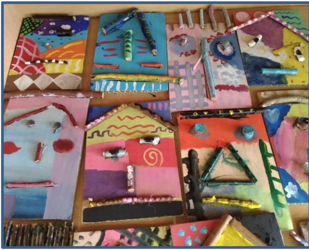
說明：「奇幻臉譜」作品 1