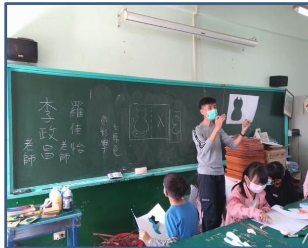
說明：講師解說「巧手拼貼」創作流程