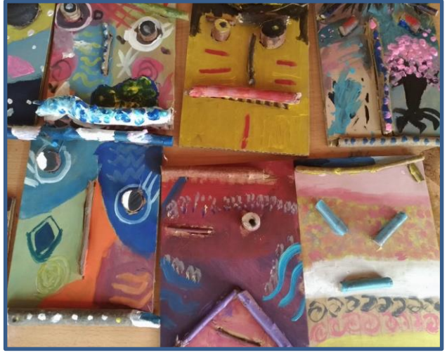
說明：「奇幻臉譜」作品 2