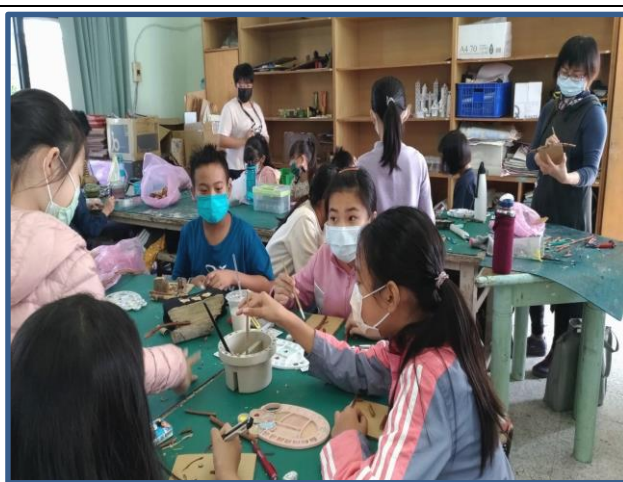
說明：彩繪「奇幻臉譜」