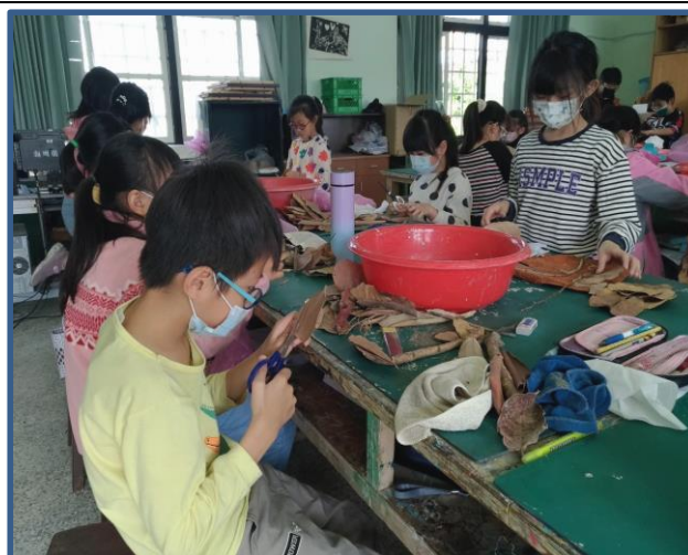
說明：整理、擦拭樹葉、樹枝