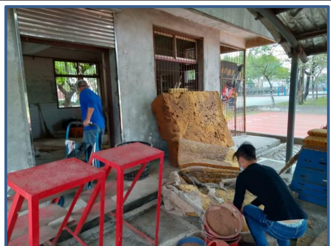
照片說明：將物品分類，留下可以再利用的