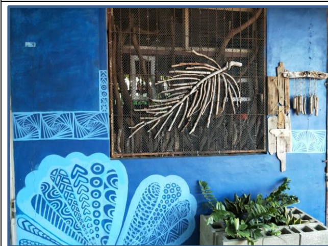
照片說明：用撿來的樹枝拼湊圖形裝飾窗口，旁邊是樹枝做成的吊飾