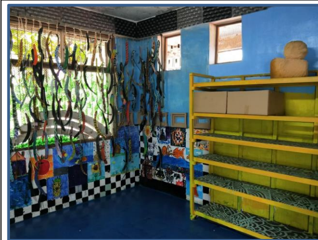
照片說明：鳳凰木的果匣彩繪後做成吊飾， 架子和牆壁彩繪後大變身