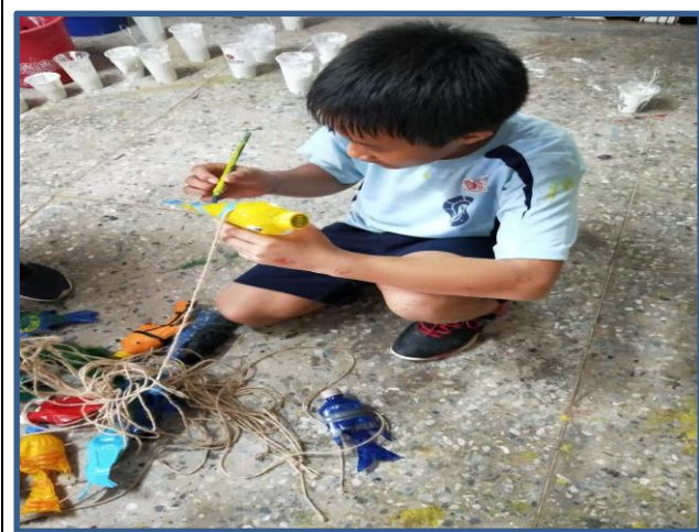
照片說明：學生將寶特瓶剪成魚的形狀並彩繪做成吊飾。