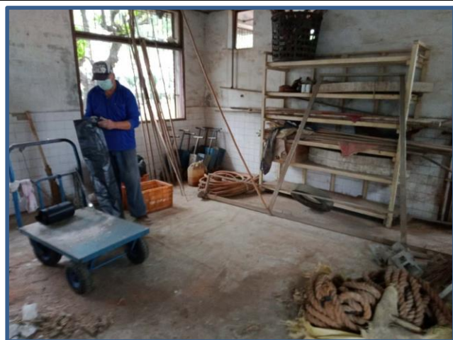
照片說明：終於看見地板了