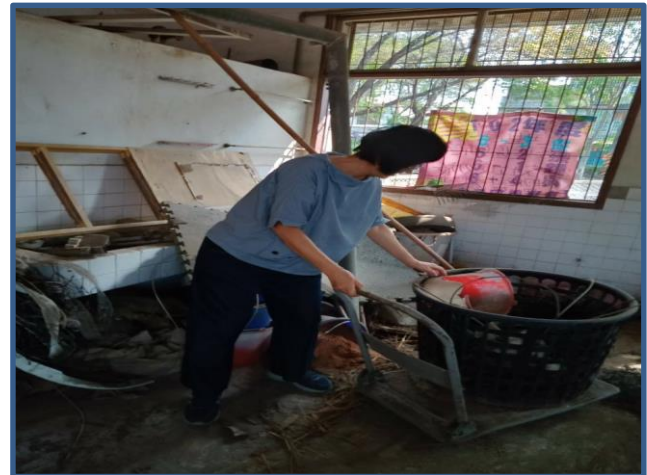
照片說明：老師們幫忙打掃