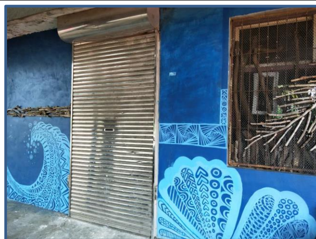
照片說明：閒置小屋大變身