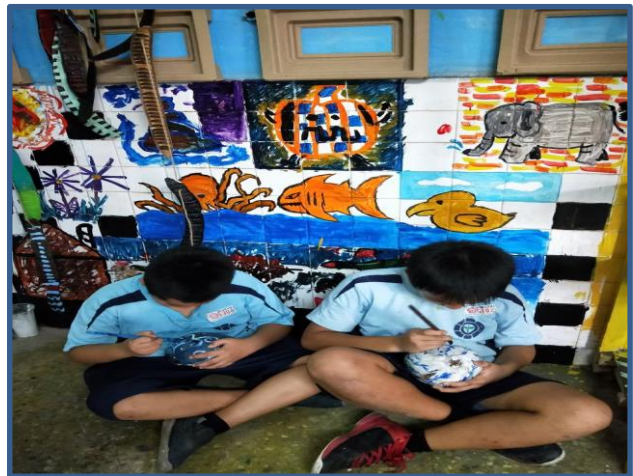
照片說明：學生彩繪椰子殼