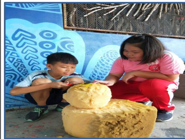
照片說明：原本小屋內的大海綿讓學生雕刻成動物形狀