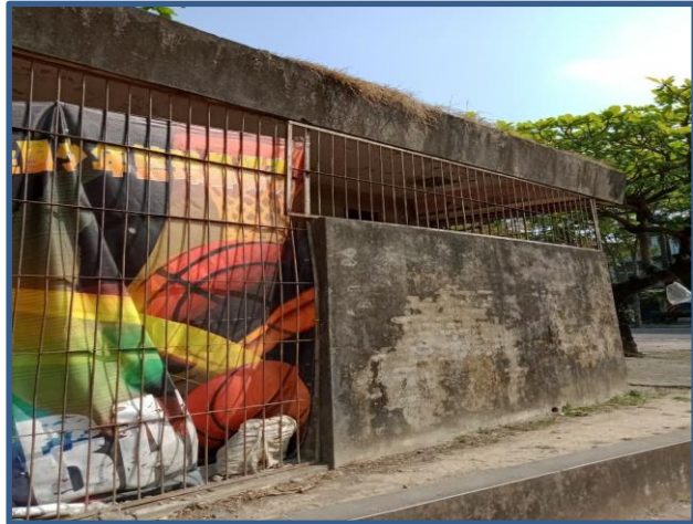
照片說明：閒置小屋原本的外貌