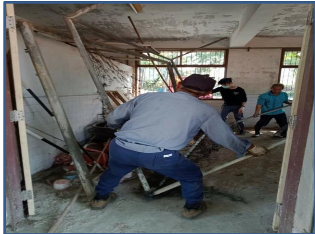
照片說明：開始清理大型球框