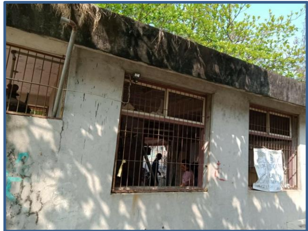
照片說明：閒置小屋破舊不堪，沒有玻璃，只剩鐵窗