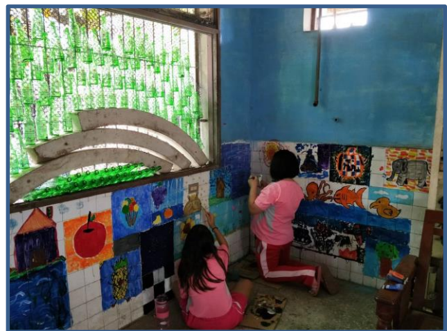
照片說明：用酒瓶做成風鈴點綴窗戶，牆壁彩繪