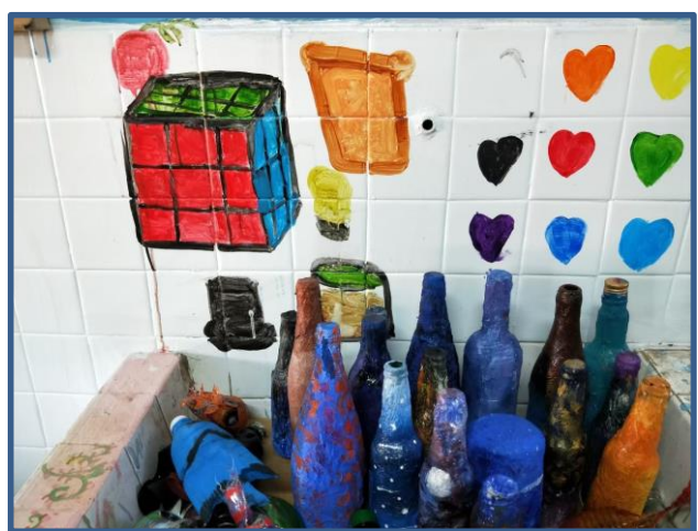
照片說明：酒瓶彩繪