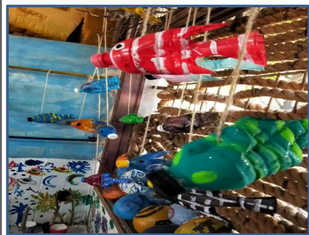
照片說明：寶特瓶做成魚吊飾