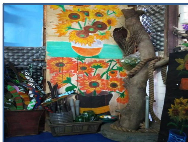
照片說明：棧板當成畫布畫上向日葵